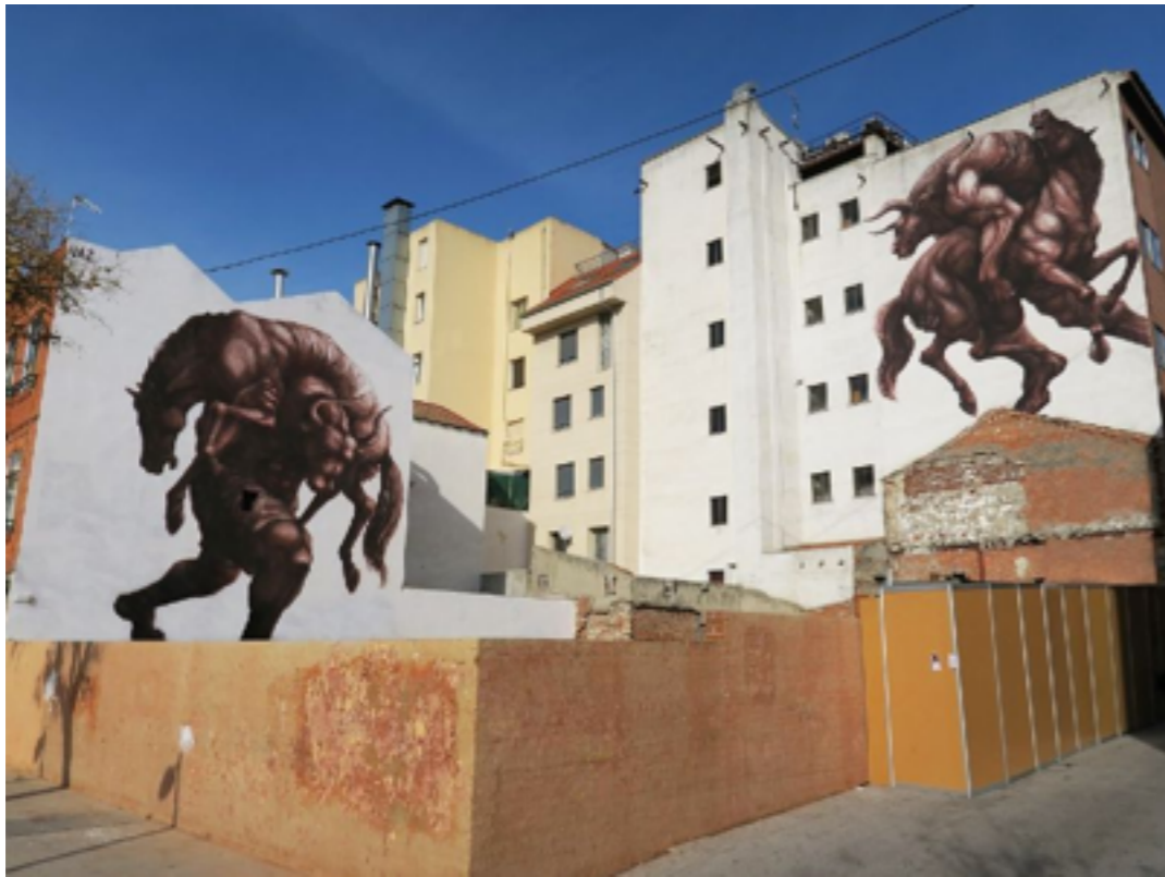
Franco Fasoli, www.streetartnews.net