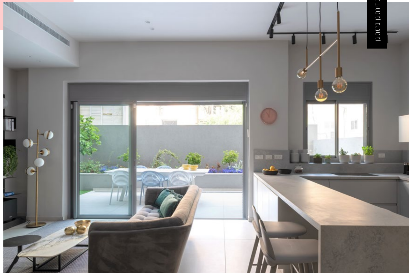
תאורה: קמחי | מטבח: מטבחי זיו