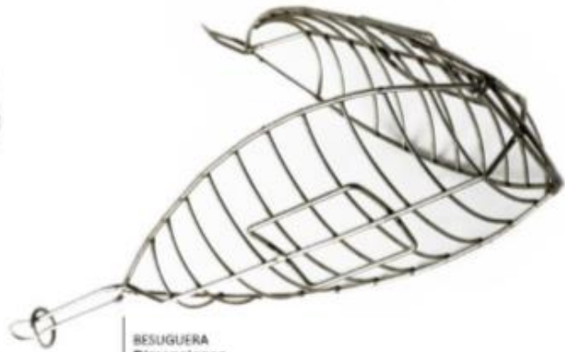
BESUGUERA Dimensiones 46 x 19 x 10 cm