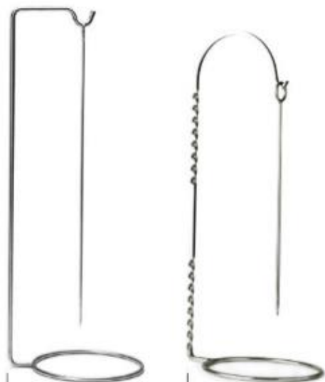
PINCHO con soporte estándar Altura 64,5 cm