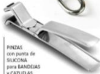
PINZAS con punta de SILICONA para BANDEJAS y CAZUELAS