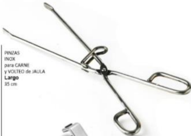
PINZAS INOX para CARNE y VOLTEO de JAULA Largo 35 cm