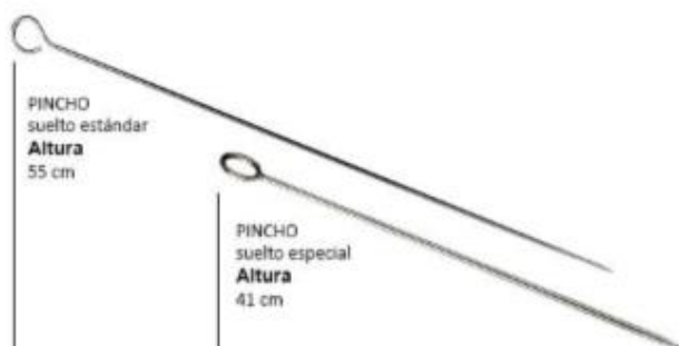
PINCHO suelto estándar Altura 55 cm