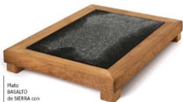
Plato BASALTO de SIERRA con SOPORTE de madera de IROKO