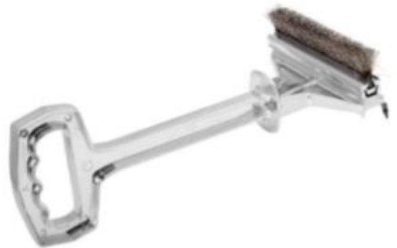
CEPILLO RASPADOR COMBINADO Largo 36 cm