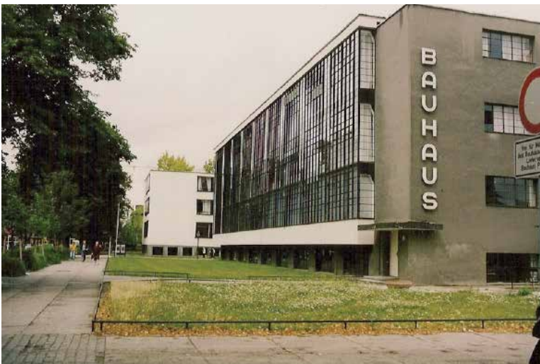
Das Bauhaus in Dessau

Der umfangreichen Forschung zum Thema Bauhaus ist das kleine, aber feine künstlerische Œuvre der Lou Scheper-Berkenkamp bislang eher entgangen.