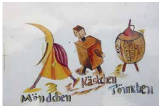
Originalvorlage aus: „Tönnchen, Knöpfchen und andere“, um 1945

durchziehen die schöpferischen Ideen des Bauhauses ihr künstlerisches Werk. In ihren Bildern finden sich die Einheitsbausteine Quadrat, Dreieck und Kreis als typische, gleichsam kubistisch-perspektivische Stilmittel der Bauhaus-Gestaltung. Schrift und Bild verdichteten sich zu einer bis dahin kaum gekannten leben-