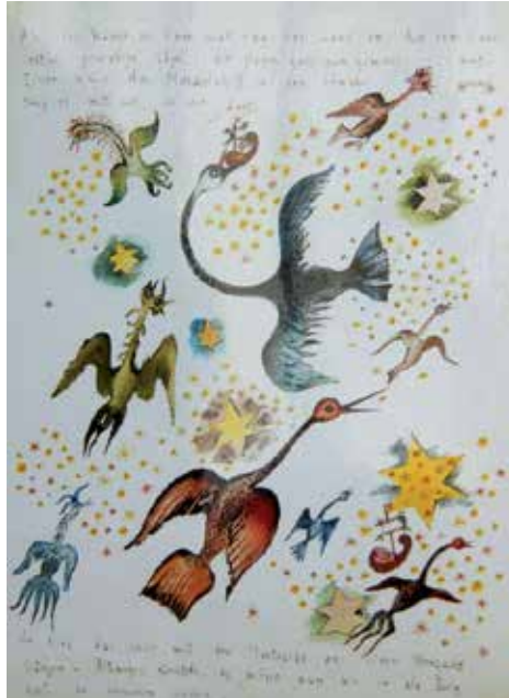
Himmelsvögel, unveröffentl., um 1940

diges Einheit phantastisch-magischer Bildgeschichten. Neben ihren Paradiesvögeln schuf sie „transzendente Wesen wie Engel und Vögel, Luftbewohner, Pegasusse, Bäume, die in den Himmel wachsen“. 9 Ihren eigenen Seelenzustand beschreibt sie in dem folgenden Zitat: „Eigentlich sitze ich lieber auf Luftlinien als auf Sesseln und finde es überhaupt schön, in der Luft zu hängen: nirgends angeheftet und nichts anhaftend an keinem Ort und überall zu Hause, an allem beteiligt und daher unbeteiligt, also etwa: ungebundene Intensität, aber leidenschaftlich [...]“ 10