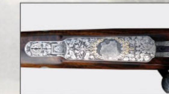
Die Gravur – ein individueller Schmuck