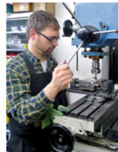
Fräsarbeit am rohen System