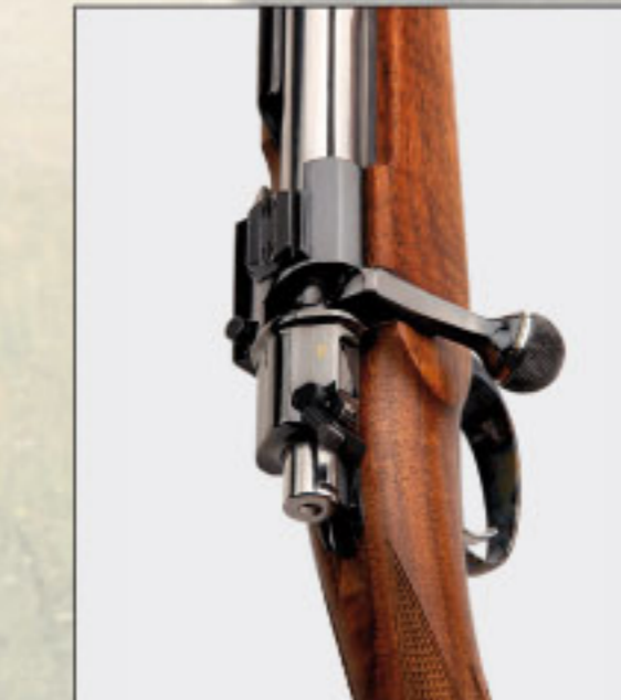
Die Drei-Stellungs-Sicherung ist absolut leicht und leise zu bedienen