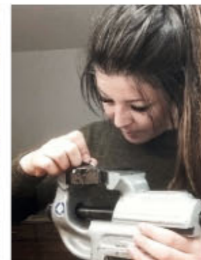
individuelle Gravuren ausschließlich in Handarbeit