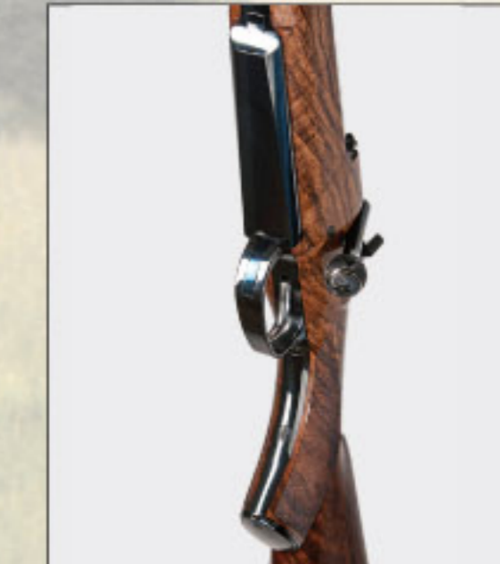
Magazin mit Klappdeckel nach unten entladbar