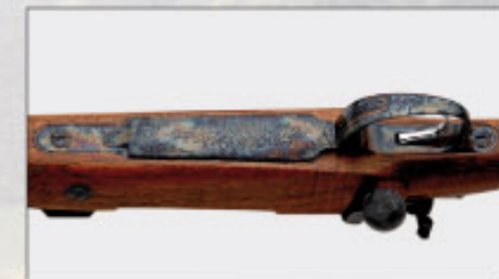
Arabeskengravur in Bunthärtung