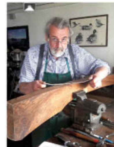
Maßschäftung am Schaftholz-Rohling