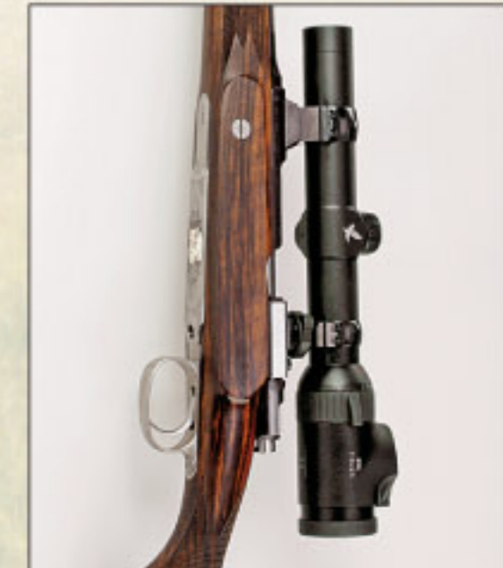
Die Kessler-Schwenkmontage bietet höchste Wechselprecision