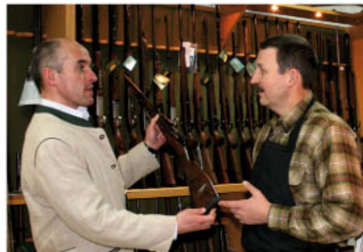
Individuelle Beratung durch den Chef ist im Hause Kessler selbstverständlich.

Sämtliche Arbeiten werden fachmännisch von Meisterhand ausgeführt.