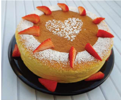
מתאים גם אחרי ארוחה כבדה