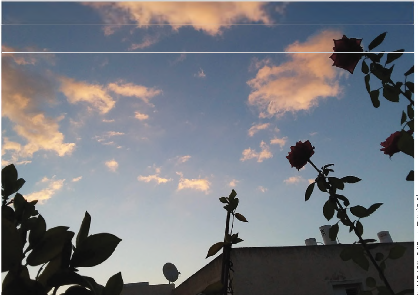
זריחה ברחוב

בס"ד כט באלול - תש"פ // גיליון 289 // רח' הרצוג 32 גבעתיים // www.gvurat-m.org // gvuratm@gmail.com // עיצוב: אורלי אליאס