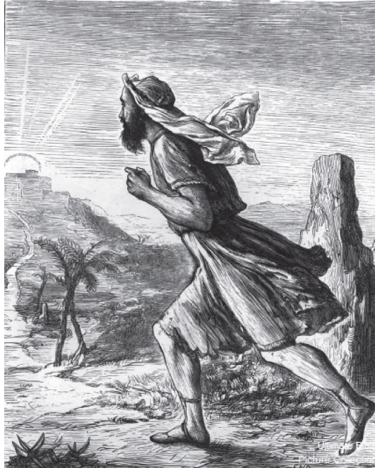
City of Refuge - Bible Encyclopedia

יהי רצון שנזכה להארת שמש התשובה עלינו ועל כל ישראל.