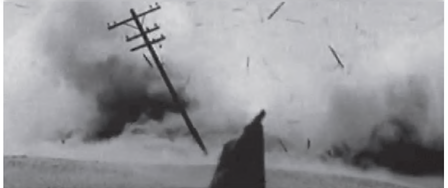
29/4/69 מצרים. פגיעה בקו מתח גבוה המוליך חשמל מאסואן לקהיר מתוך סרט מורשת מלחמת ההתשה