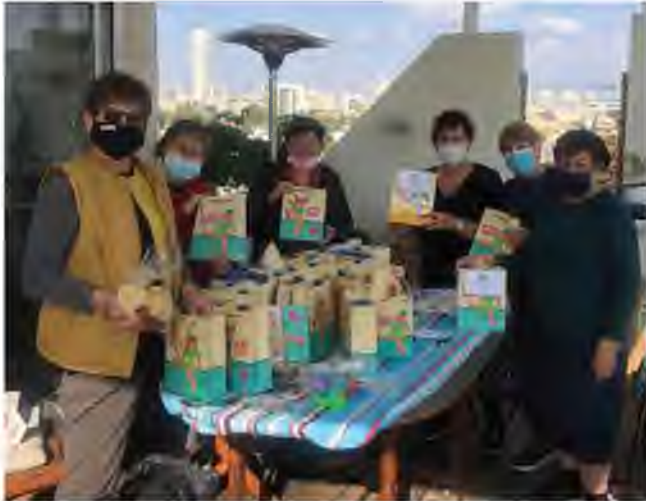
אריזת קיגל ובירה לקראת תחרות הצ'ולנט