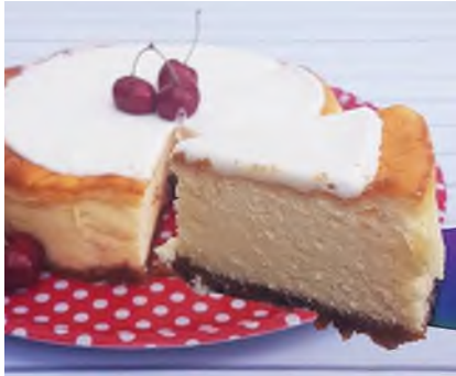
עוגת גבינה: קרה או אפויה?