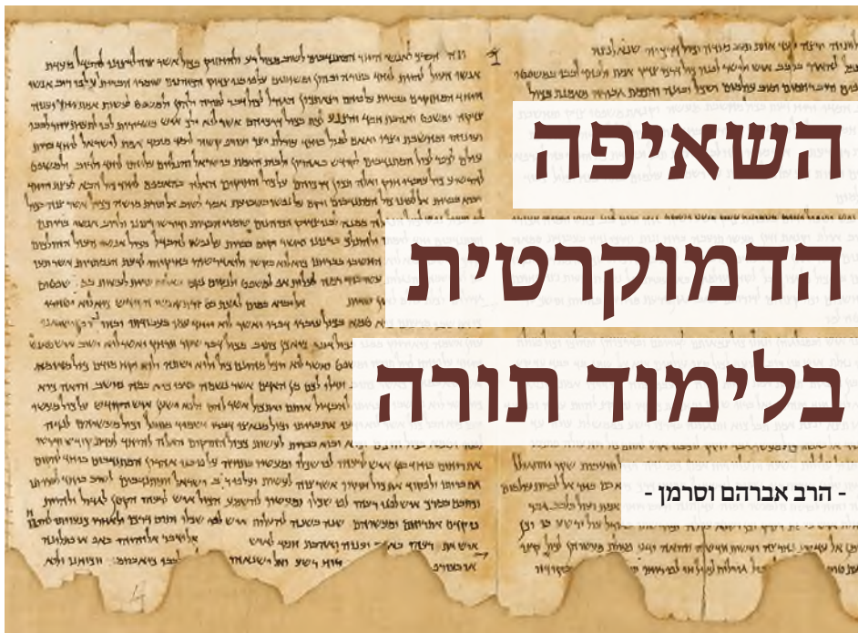
מגילות קומוראן

"וְעַתָּה לָמָּה נָמוּת כִּי תֹאכְלֵנוּ הָאֵשׁ הַגְּדֹלָה הַזֹּאת אִם יִסְפִּים אֲנַחְנוּ לְשָׁמֹעַ אֶת קוֹל ה' אֱלֹהֵינוּ עוֹד וּמִתְנֹה. כִּי מִי כָל בְּשָׂר אֲשֶׁר שָׁמַע קוֹל אֱלֹהִים חַיִּים מְדַבֵּר מִתּוֹךְ הָאֵשׁ כְּמוֹנוּ וַיְחִי (דברים ה, כא). משה אמנם הסתייג מדבריהם: וכי לא היה יפה לכם ללמוד מפי הגבורה ולא ללמוד ממני? (רש"י שם). אבל הקב"ה