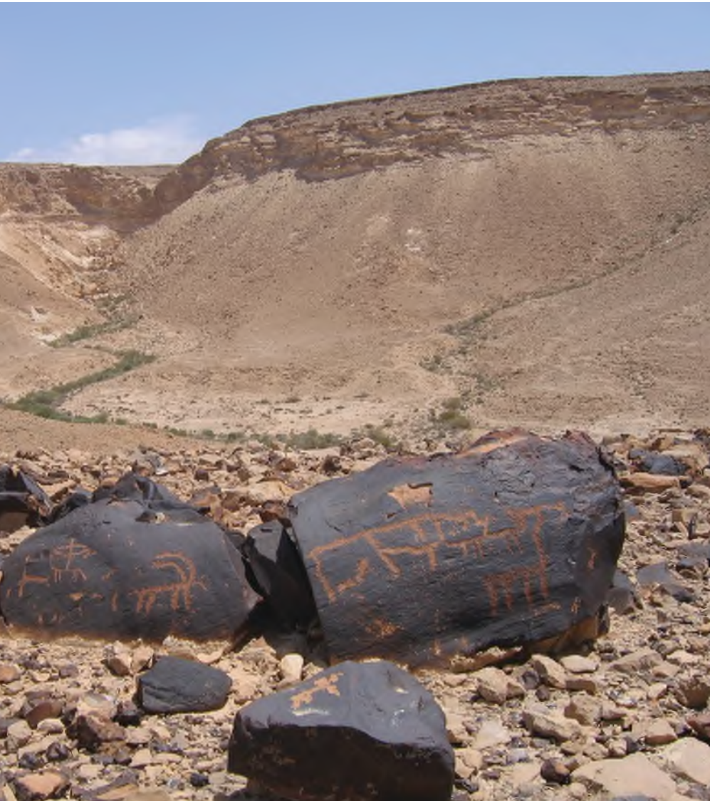
ציורי סלע בהר כרכום

ברח ארבעים יום וארבעים לילה עד אשר הגיע "עד הר האלוקים, חורב", ושם הוא נכנס אל מערה - שהיא אותה "נקרת הצור" עליה מסופר בתורה שבה ראה משה את כבודו של הקדוש ברוך הוא. אולם מאז ימי אליהו הנביא לא נודע מיקומו של הר סיני. החוקרים בדורות האחרונים חלוקים בגישתם. הנוצרים, ואחריהם המוסלמים, החליטו שהר סיני הוא ג'בל מוסא שבדרום סיני. ועכשיו, בארבעים השנים האחרונות החליט פרופסור יהודי שהר סיני נמצא במקום אחר לגמרי. פה, קרוב מאוד, בנגב הדרומי בשולי הצפוניים של נחל פארן - בהר כרכום. שם ניתנה התורה. דרך שם עבר עם ישראל בנדודיו. האפיפיור הכריז לפני 16 שנה כי הוא מכיר בכרכום כהר קדוש. שזה הר האלוהים עליו כתוב בתנ"ך. והיפה בכל