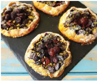
קינוח קליל, צבעוני וטעים - ללא צורך בתבנית