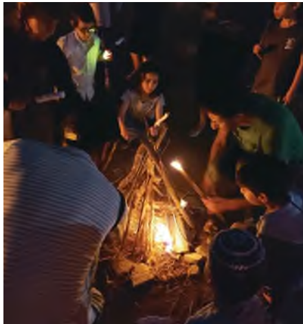
ל"ג בעומר

לכבוד ל"ג בעומר השתתפו הילדים בפעילות בשיתוף חב"ד, שכללה סדנת בועות סבון ועוד הנאות.