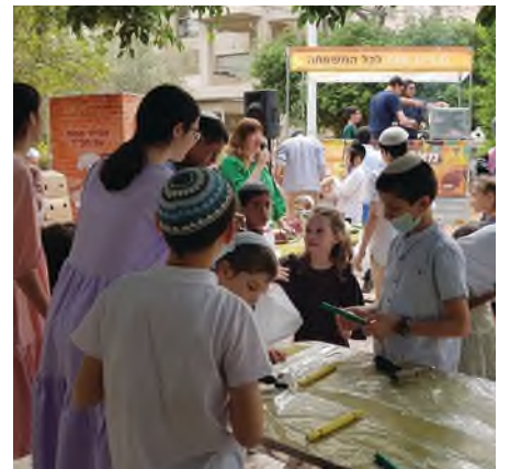
אפיית מצות

לקראת חג הפסח התקיימה פעילות אפיית מצות לילדים, בשיתוף עם חב"ד. המבוגרים שמעו שיעור מרתק מפי ד"ר יושי פרג'ון בנושא "הגדה כפשוטה".