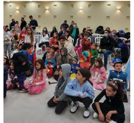
חגיגת פורים

בחג הפורים, לאחר קריאת המגילה נהנו הילדים מן המופע של יניב ונטורה והחיות בחסות המדור למורשת ישראל של עיריית גבעתיים ובשבת הסמוכה לפורים נערכה תחרות הצ'ולנט המסורתית שאותה ליווה האורח המיוחד ד"ר רועי יחביץ' במופע על-חושי פורימי.