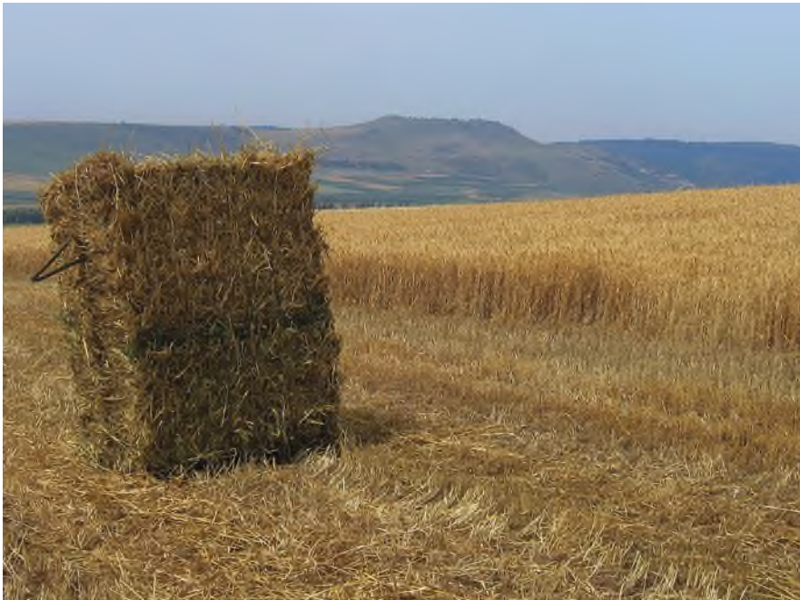
צילום: מימי נוי

בס"ד י"א סיון - תשפ"ב // גיליון 294 // רח' הרצוג 32 גבעתיים // www.gvurat-m.org // gvuratm@gmail.com // צילום: חברי הקהילה // עיצוב: אורלי אליאס