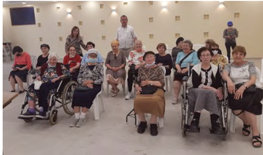
צילום: אמירה אימברגר'מובנה

במקום שבו התחילה את דרכה. אהבתה הגדולה השנייה היא לטבע ולטוילים ברגל בארץ ובעולם, בעיקר בהרים. בהיותה בחוץ היא מחפשת כל הזמן שילובים ומפגשים בין הרים, בין אור לצל, בין צבעים והשתקפויות. עם כל יציאה לטבע היא לוחשת לעצמה: "אני בדרכי לראות משולשים". החיבור בין המרחבים לאיור הממוחשב הוליד את כינוי החיבה שלה: "עכבר שדה". בתערוכה הוצגו איורי נופים מן הטבע ומן