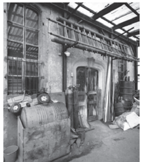
בית הכנסת בעיירה היינסהיים: מימין לפני השיפוץ ומשמאל לאחרי