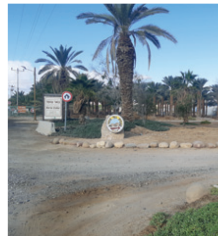
שלט פסיפס המראה את כיוון הנסיעה לתצפית הנמצא לפני שער הכניסה למושב

עוד ארוך. תכנון נכון מאפשר גיבוש משפ- חתי והתנסויות חדשות. כך, בערב הראשון הנוער הכין לנו 'פויקה' בחביות שמיעדות לכך, ובערב השני הם פינקו אותנו במנגל. יש מספיק זמן להכין ולאכול בשעה סבירה - וגם נשאר זמן בהמשך הערב למשחקי חברה סוערים!