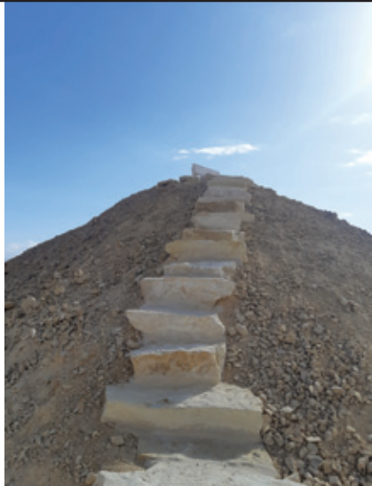
המדרכות שבצידה האחד של הגבעה העולה לפינה שהוקמה לזכר הבנים של צופר שנפלו במלחמת חרבות ברזל

גבוהה במיוחד, כמותה יש במדבר בלי סוף, אבל זו הגבעה של קהילת המושב. זו שילדי המקום הקטנים מביטים עליה ומדמים אותה להר. כל כך גבוהה ונישאת היא בעיניהם. כל ילד וילדה בתורם, בחדווה של ילדים, כובשים את פסגתה. על גבעה זו, בין השאר, היו חברי המושב מדליקים כל שנה לפידים לרגל חג החנוכה, באופן לא מוסדר.