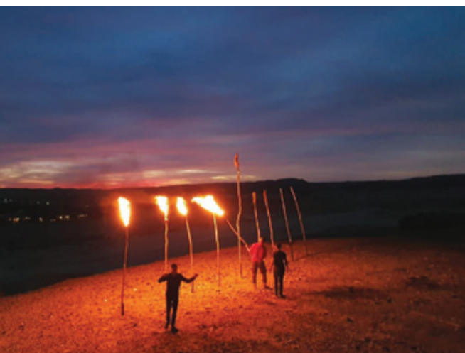
הר צופר בהדלקת לפידי חנוכה ולפני בניית התצפית שבתמונה מימין