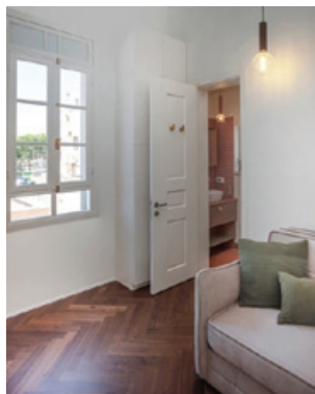
דוגמה מעבודותיה של האדריכלית הילה ישראל

מקום על המדף ובראש. עד כדי שלא מאפשרים לנו להיות בתכלית שלנו. לא מאפשרים לנו לראות מה באמת יש לנו. גם בפיזי - איזה בגדים, כלי מטבח, משחקים וכו' וגם מייצרים עומס שלבסוף משפיע כך שלא נוכל לראות מה באמת יש לנו: בריאות איתנה, עבודה, בית וכו'.