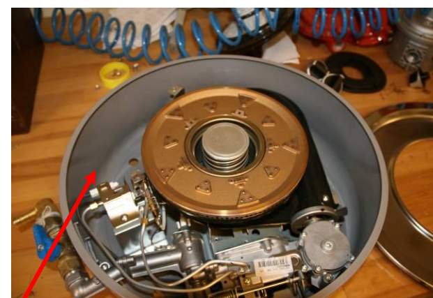
מבט על , מערכת הגז ללא הפנל העליון